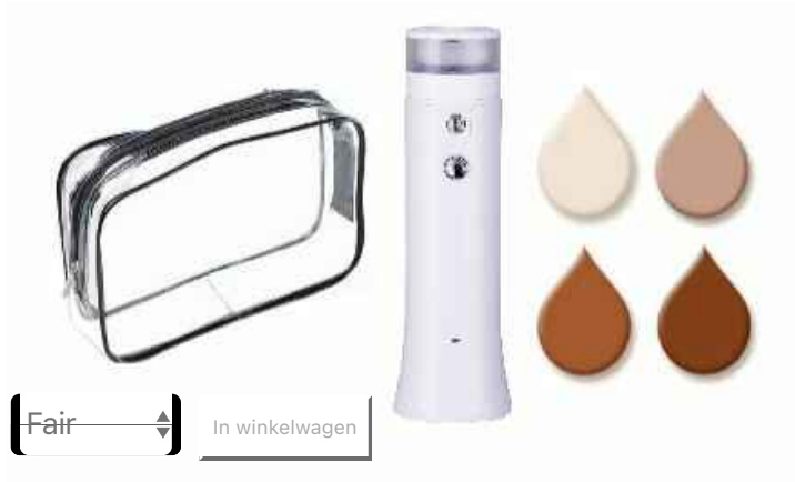
Skinair Foundation Mist Sprayer White € 129,00 € 109,00