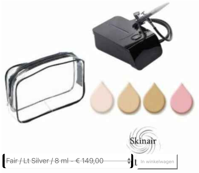
Corrective Kit € 149,00